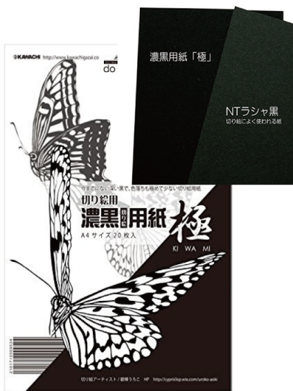
両面黒 初心者～上級者向け