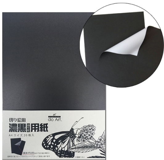
片面白 初心者～上級者向け